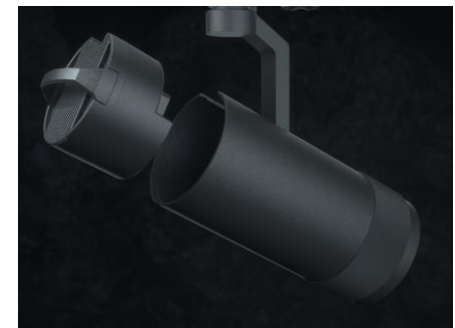
20W,25W,30W Non-Dim Treiber wechselbar