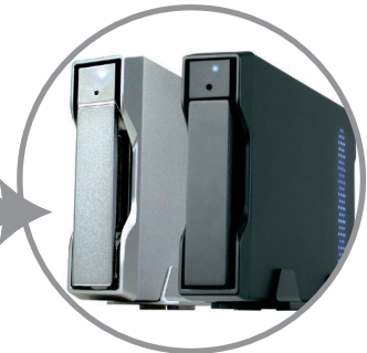
Stardom i302 (seperat erhältlich)